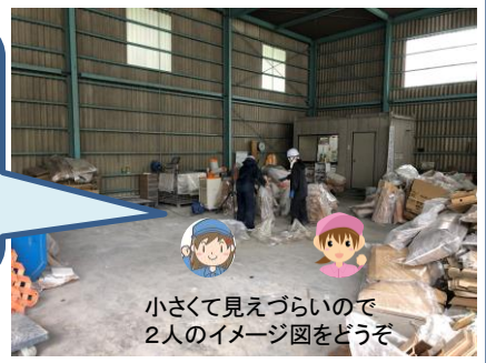
小さくて見えづらいので2人のイメージ図をどうぞ

今回は「まごころの家」の方とダイイチ企業女子社員2人が働いている施設を紹介させていただきました。屋外の作業や力仕事は大変で男性が働くイメージですが、重いものは協力して持つ、声を掛け合って作業するなど工夫して、女性も障がいのある方も戦力となって業務を行えることがわかりました。